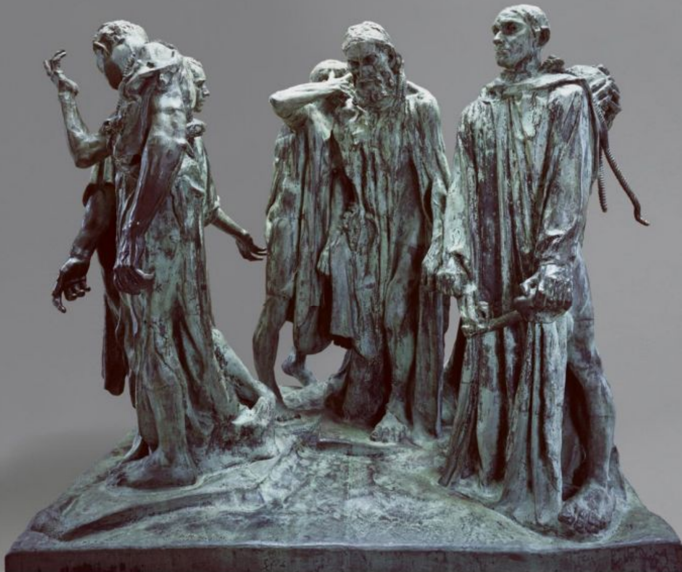
The Burgers of Calais

Bronze 209.6 x 238.8 x 190.5 cm. Modeled 1884-95; cast 1919-21