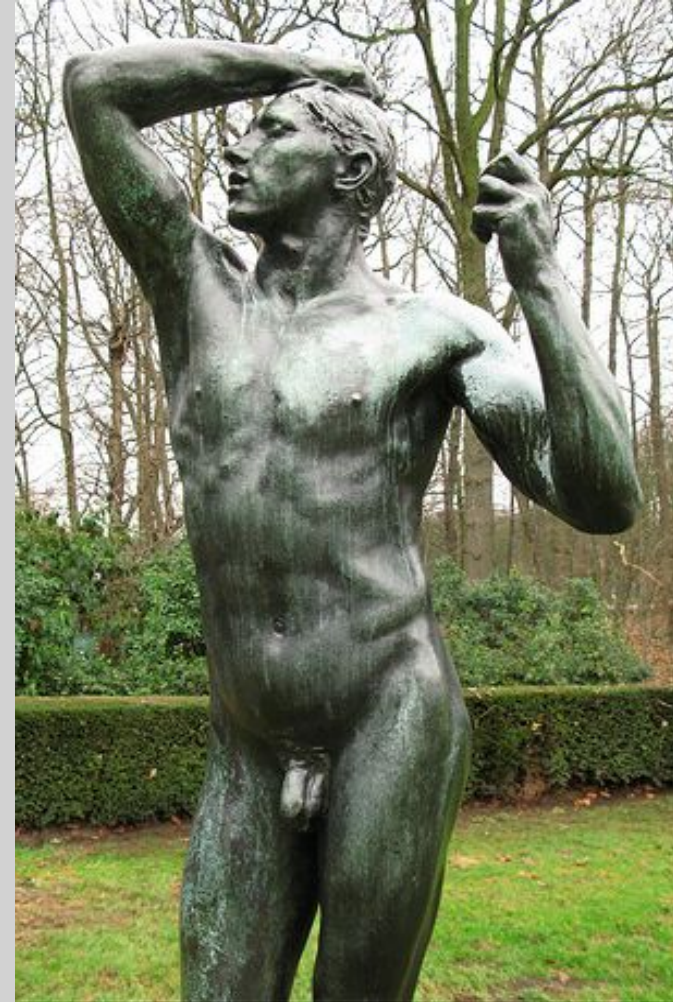
Auguste Rodin (French, 1840–1917) The Bronze Age, modeled 1876 bronze cast ca. 1906 182.9 cm

הפסל תקופת הברונזה, שנוצר על ידי רודן בעקבות מסעו לאיטליה ובהשראת הפיסול של מיכאלאנג'לו הזניק את הקריירה שלו. הפסל ריאליסטי בהשראה קלסיציסטית, הדמות צעירה בעלת עוצמה גופנית, מדויקת מבחינה אנטומית ומעוררת השראה.