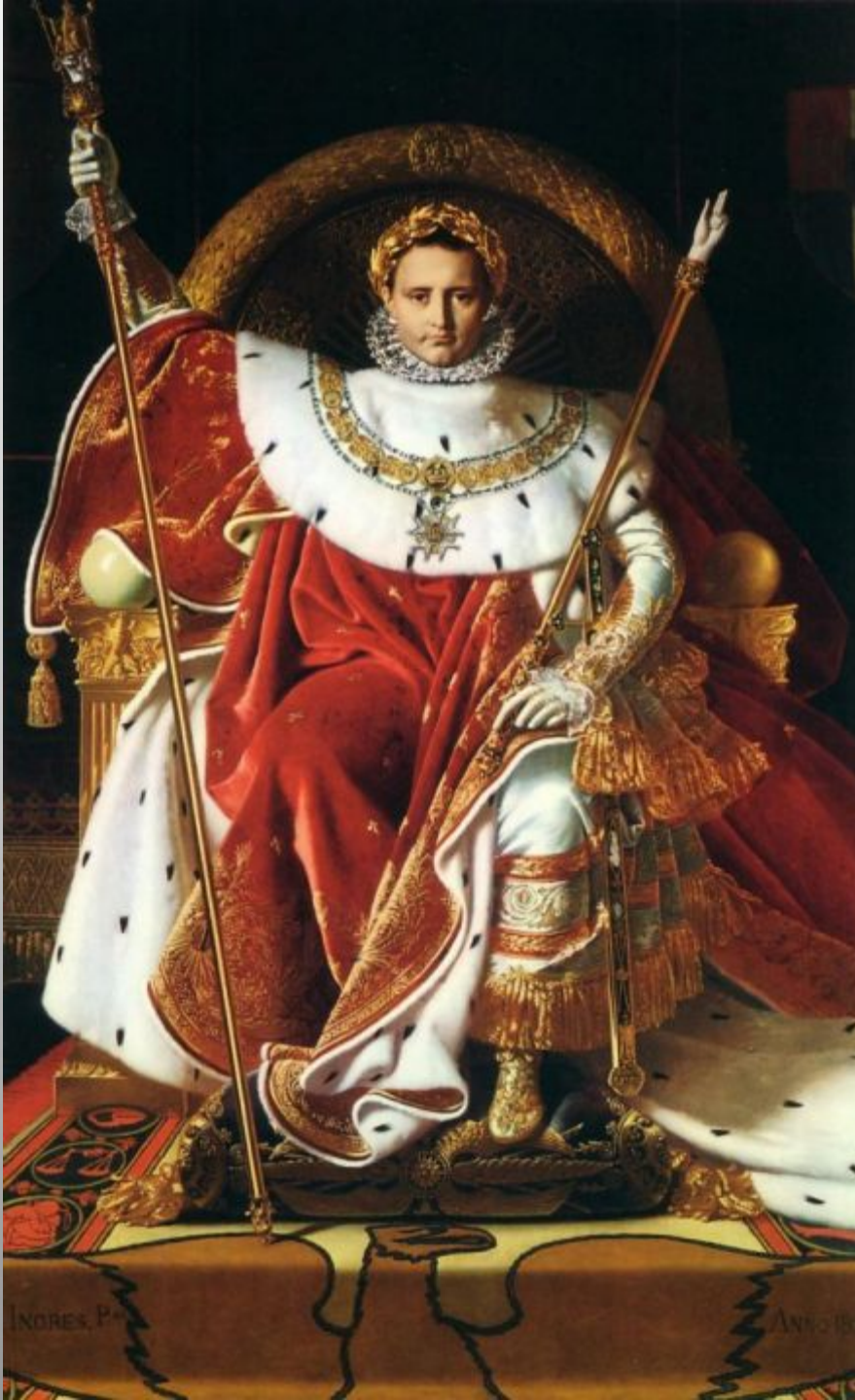
Ingres, Jean-Auguste-Dominique 1780-1867 Napoleon Sur le Trone Imperial, Paris Musee de l'Armee 163 cm 1806

נפוליון על כס המלכות, מסביבו סמלי שלטון, גופו כמעט נעלם. מתחת לגלימה המלכותית האדומה. לראשו כתר זהב, כזר של מנצח בעת העתיקה. על כתפיו שרשרת המסמלת שלטון. בידו הימנית הוא מחזיק את שרביט השלטון ובידו הימנית את "יד הצדק". השימוש בצבעי אדום, זהב ולבן מסמל מלכות. ראשו של נפוליון מבצבץ מתוך כל הסט הזה בצורה מוזרה. לצופה בן זמננו נראית התמונה נלעגת. מבחינה ציורית יכולתו של אנגר נגלית כאן בטקסטורות של כל החומרים ובצבעוניות המלכותית.