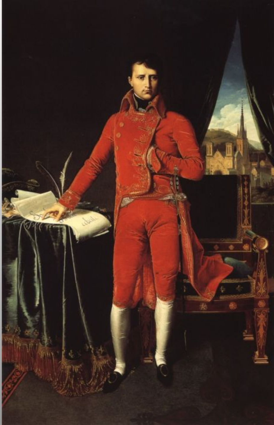
Ingres, Jean-Auguste- Dominique (1780-1867 Napoléon Bonaparte, Premier Consul 1804