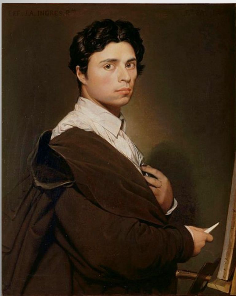
Self-portrait at age 24, 1804 (revised ca. 1850) oil on canvas, 78 x 61 cm